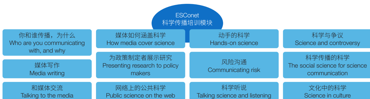
图2 “欧洲科学传播网络”科学传播培训模块